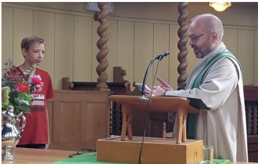
Foto 1: 50 jaar Sweelinckhof, zie pg. 5 Foto 2: Vrede van Breda, zie pg. 23 Foto's 3 en 4; Startdienst, zie pg. 4 Foto's 5 en 6: Natuur bij de kerk in Benningbroek, een preekstoel?