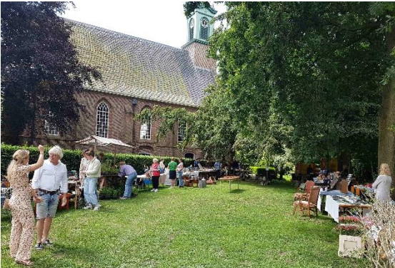
2 juli zomermarkt op het grasveld voor de kerk van Sijbekarspel.