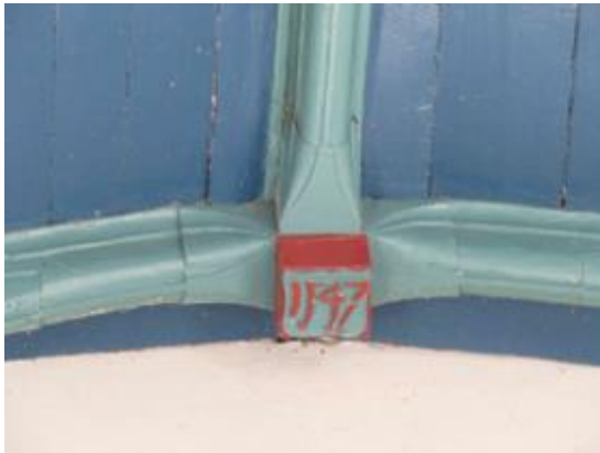
Sluitstuk kerk Sijbekarspel

Boven het vanuit de kerkzaal zichtbare tongewelf bevindt zich een gotische kapconstructie van spitsbooggebinten. Die zijn gemaakt van eikenhout en voorzien van Arabische telkenmerken. De gewelfribben (in de kerk zijn die geschilderd, in de ruimte onder de toren zijn ze nog van blank hout) hebben een peerkraal-