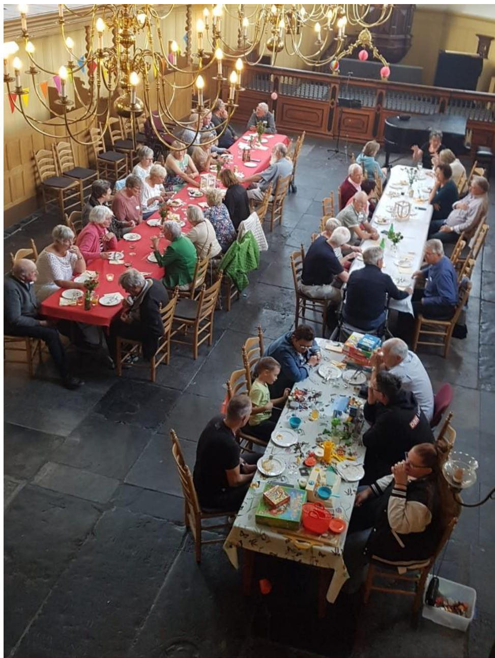
Barbecue in de kerk van Wognum