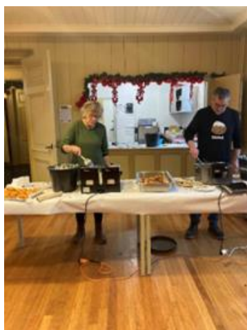
Oliebollen voor Oudjaar