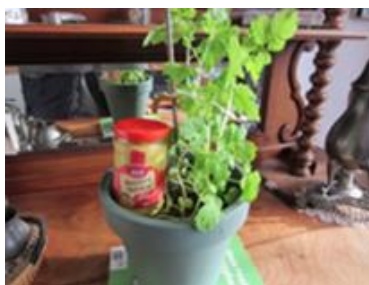
Mosterdplant van Koen Scholten. Hoe groot is uw plant?